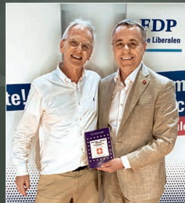
Bundesrat Ignazio Cassis & Sven Bradke: ein Ziel – ein Weg!