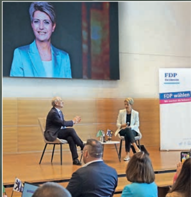
Bundespräsidentin Karin Keller-Sutter im Interview mit unserem Geschäftsführer.