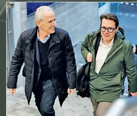
Ständerat Benedikt Würth auf dem Weg zum Zukunftsanlass der IHK St.Gallen-Appenzell.