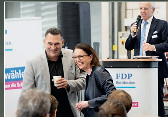
Zwei freisinnige «Spitzen» aus dem Kanton St.Gallen.