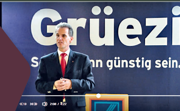
Gratulation und Dank an ALDI SUISSE! Vor 20 Jahren startete die «ALDISierung» der Schweiz. Wir waren dabei!