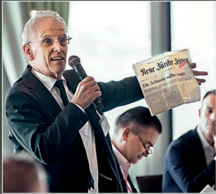
«Die Schweiz sollte es wagen», so der Kommentar der NZZ zu den Bilateralen III.