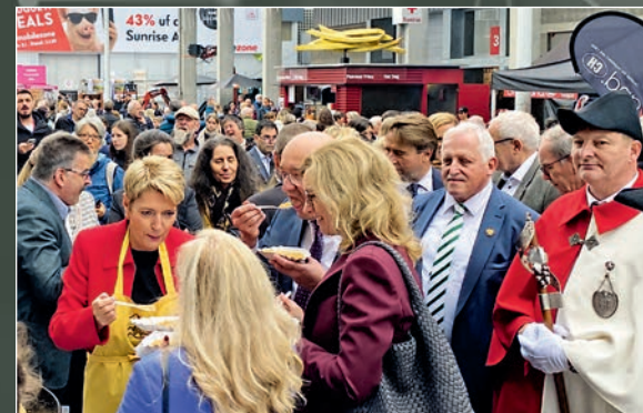
St.Galler Bundespräsidentin als Ehrengast an der OLMA.