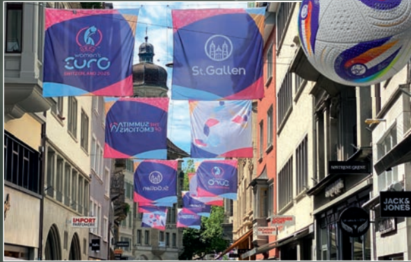
Die Fussball-Europameisterschaft der Frauen war zu Gast. Danke an Stadt und Kanton St.Gallen für die schönen Momente!