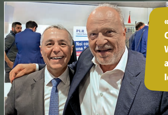
Freunde, trotz unterschiedlicher Positionen zu den Bilateralen III.

«Ein starkes Netzwerk ist in der Geschäftswelt von unschätzbarem Wert. Durch den Austausch mit anderen Fachleuten entstehen neue Ideen, Chancen und Kooperationen.»