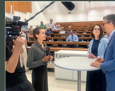
Die Rundschau von SRF 1 «testet» das neue FDP-Co-Präsidium in Buchs.