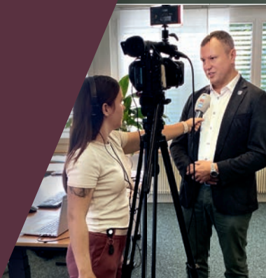
Der Steckborner Stadtpräsident im Interview zum neuen Ärztezentrum.