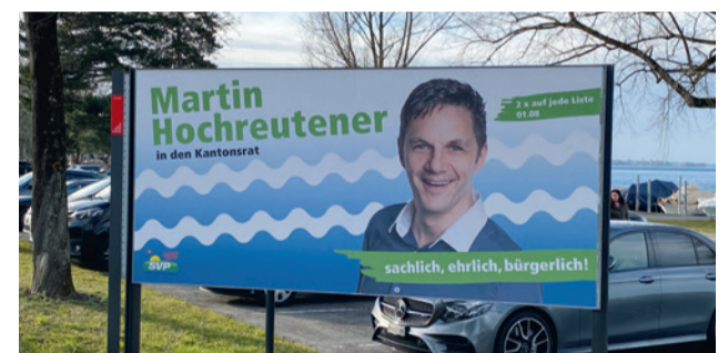
Für Goldach im Einsatz