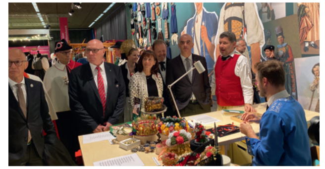
Danke für den OLMA-Besuch, Herr Bundesrat Berset!