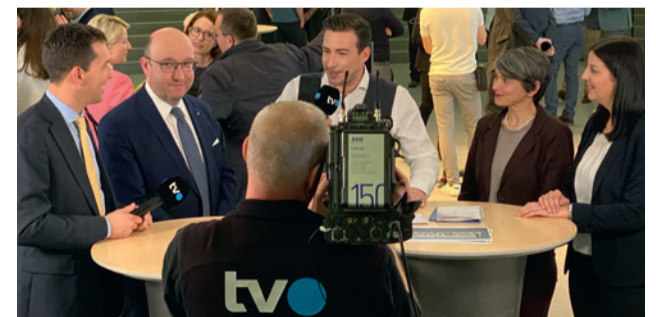
Politik ohne Medien – ein Unding!