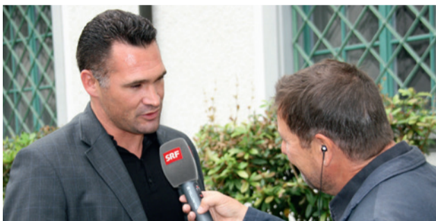
Nationalrat Marcel Dobler im Kreuzverhör