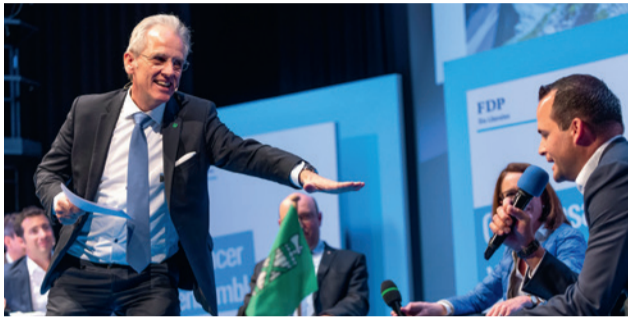
Parteitag in Flawil mit Ständerat Damian Müller (LU)