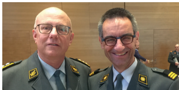
Danke, Herr Korpskommandant – danke, lieber SOG-Präsident!