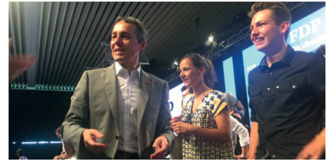
Unser Aussenminister aus dem Tessin: Ignazio Cassis