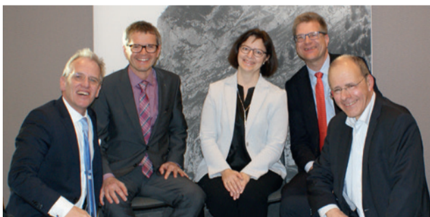
«Top Shots» der Schweizer Gesundheitspolitik