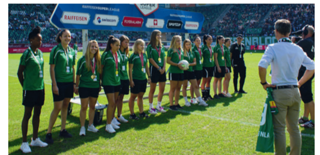
Top! Die Frauen des FC St.Gallen-Staad spielen wieder in der NLA.