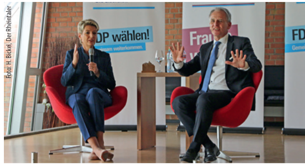
Der Stolz der St.Galler FDP: Bundesrätin Karin Keller-Sutter

Die Eventabstinenz während der Corona-Krise hat gezeigt, dass persönliche Treffen, Veranstaltungen, Diskussionen sowie Kultur- und Sportbesuche zum Lebenselixier von uns Menschen gehören. Videokonferenzen sind ok. Für den geistigen Austausch sind persönliche Gespräche in angenehmer Atmosphäre aber wesentlich prägender. Wir freuen uns auf die Zeit, in der persönliche Kontakte wieder ohne Angst und Abstandsregeln möglich sind.