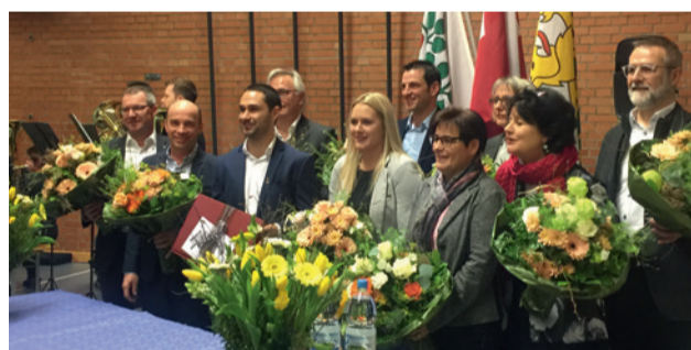
Amriswil hat einen neuen «Stapi».