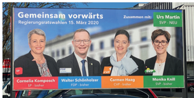
Herzlichen Glückwunsch, liebe Thurgauerinnen und Thurgauer!