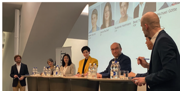
Die «Neuen» beim Kandidatenpodium