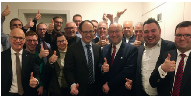
Optimismus bei der FDP-Familie (vor Corona)