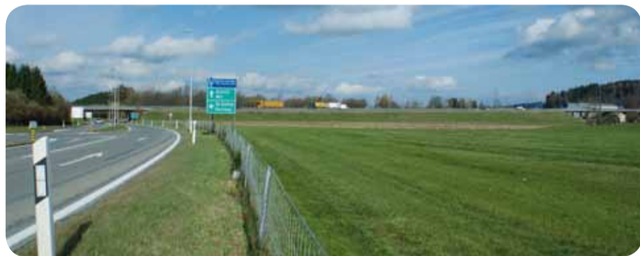
Standort der geplanten Gewerbe- und Industriezone Sommerau Nord

Über 1400 Gossauer und Arnegger Stimmberechtigte unterschrieben in wenigen Tagen die Volksinitiative zur Umzonung des Gebietes Sommerau Nord. Sie fordern die Schaffung von neuem Gewerbe- und Industrieland an einem verkehrstechnisch idealen Standort. Die Mediapolis wurde zur Analyse der politischen Situation sowie zur Ausarbeitung, Lancierung und Begleitung der Volksinitiative beigezogen. ◻