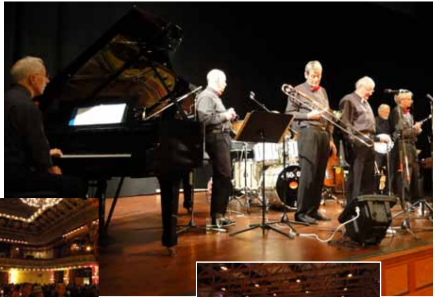
Impressionen vom 51. SAMM-Kongress in Interlaken